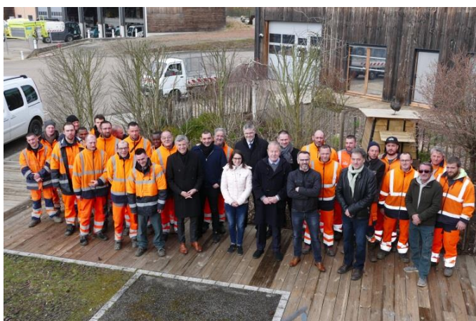
Photo 1. Les équipes des Espaces Verts et de la Maintenance des Espaces Publics

La Ville de Montigny-lès-Metz vient d'être labellisée « Commune Nature ». Une distinction décernée lors d'une cérémonie organisée par la Région Grand Est et l'Agence de l'eau Rhin-Meuse au NEC (Nouvelle Espace Culturel) de Marly le mardi 26 mars.