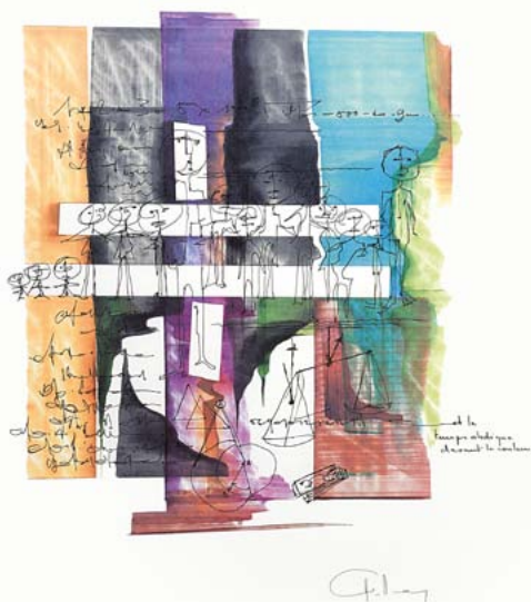
© et le temps abstrique devant la couleur, 1995

« Encre transparentes encre acryliques et cire diluée bitume de Judée et pâte d'acier crayon gras, mine de plomb et collages toutes matières traitées, pour construire l'espace-couleurs en accord parfait avec la texture, la valeur visuelle du support brut ou retravaillé »