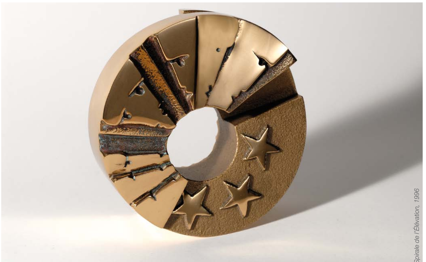
Spirale de l'Élévation, 1996

IGOR, DERNIÈRES NOUVELLES D'ALSACE, VENDREDI 23 JUIN 1978. EXPOSITION COLMAR, KOÏFHUS SALLE ROESSELMANN, JUIN 1978.