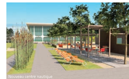
Nouveau centre nautique