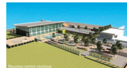
Nouveau centre nautique