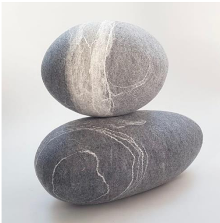
E. COUTANT, C. de la GASTINE Kayu Création