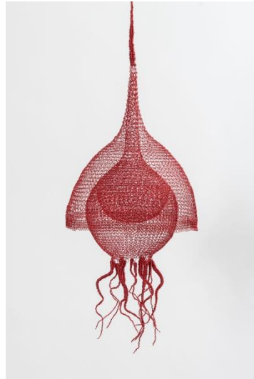
Delphine GRANDVAUX