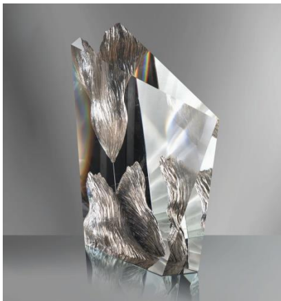
Christophe PETITJEAN dit SILTOF