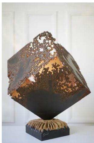
Alexandre DOUCET