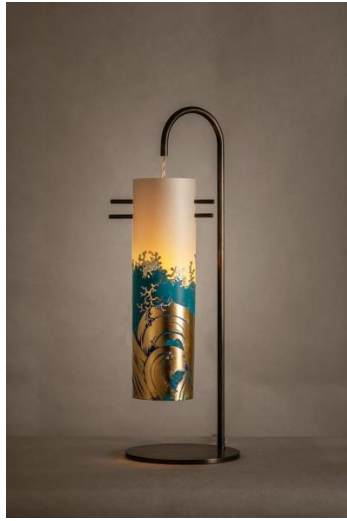
Sophie THEODOSE