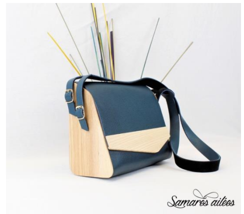
Typhaine RIFFARD Les Samares Ailées